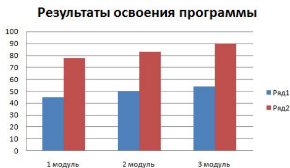
Диаграмма 1 – Результаты освоения программы «Хореографический коллектив «Эверест»

По результатам анализа оценочных материалов одной из групп обучающейся по программе «Хореографический коллектив «Эверест» были получены результаты, подтверждающие наличие положительной динамики результативности в уровне освоения программы и развитии учащихся (Диаграмма 1).